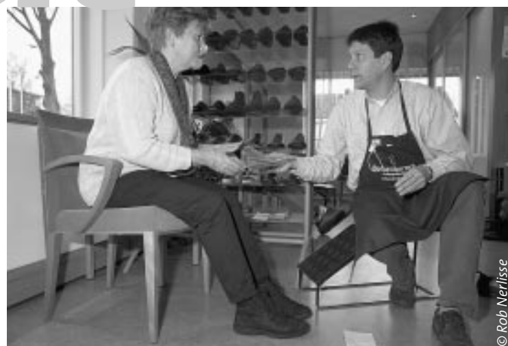
We nemen de tijd voor een goed advies, want de klant wil herkend en erkend worden.

En Medi Point Parkstad gaat verder. Naast Hanssen zullen ook andere bedrijven en instellingen in de zorg zich hier vestigen. Zo moet het een locatie worden waar je naar toe gaat voor een oogmeting, fysiotherapie, een gehoorapparaat en tal van andere hulpmiddelen en diensten, waaronder natuurlijk orthopedisch schoeisels en alles wat daar mee te maken heeft.