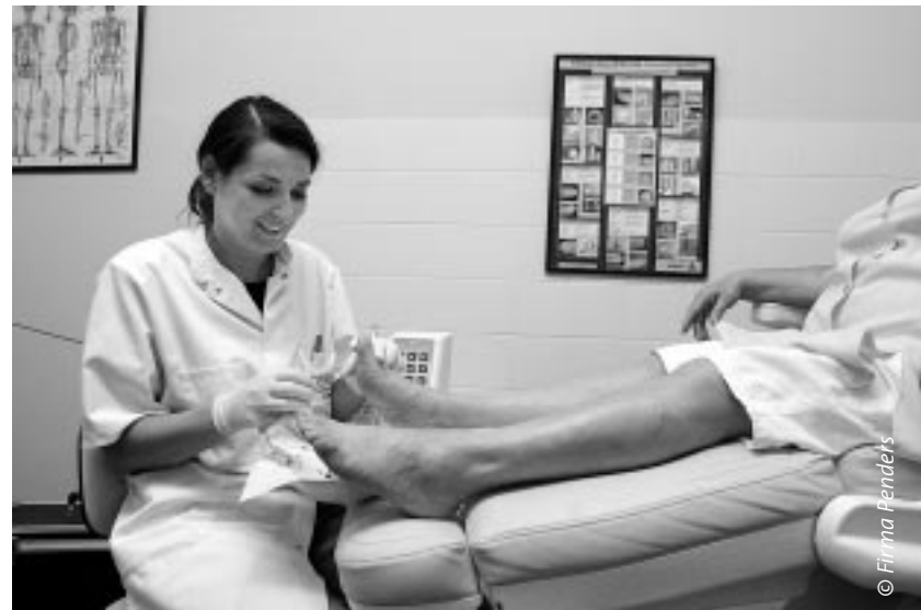
De podotherapeute kijkt met een paramedisch oog naar de voet.

gebruik kan maken." Het gebeurt al, mondjesmaat. In een aantal ziekenhuizen werken de zogenaamde voetenteams, waarin zowel podotherapeut als schoentechnicus zijn vertegenwoordigd. Franssen: "We horen van specialisten dat ze gecharmeerd zijn van deze aanpak."