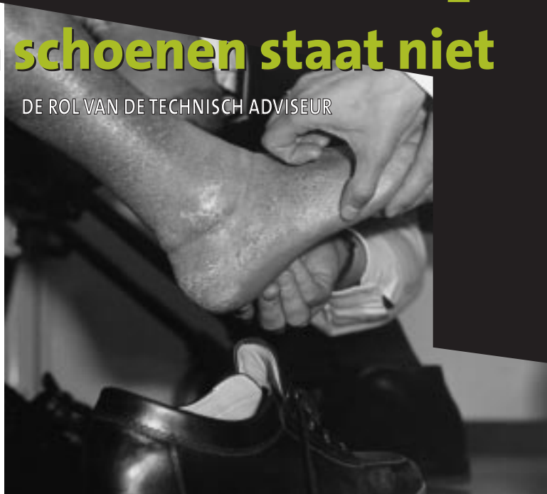
Een goede en verantwoorde pasvorm